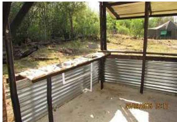
die "oopplan" kombuis