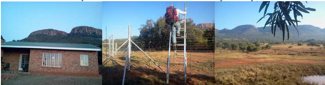
Die Rugsak oornag-akkomodasie.

Ons het geslaap in die dormetries. Daar is 6 kamers met 3 dubbelbeddens elk. 4 kamers op die boonste vloer en 2 kamers op die onderste vloer. Nomades het 3 kamers betrek en 'n ander groep die ander 3 kamers. Daar 'n klein maar baie netjiese kombuisie met permanente warmwater, 'n Groot yskas en 'n gasstofie. Basiese eetgerei is beskikbaar. Maar die groot kuier en kosmaak gebeur maar meeste buite om die groot braai/kuier area buite wat 50% onder dak is. Die ablusie is 'n baie netjiese gebou'n paar meter weg van die slaap/braai fasiliteite. Sowat twee jaar gelede opgegradeer en oorgebou. Somige van ons het selfs ontuis gevoel in die luukse. Maar die baie mense van ons twee groepe saam het maar sy tol ge-eis op die warmwater in die storte en party van ons het minder warm gestort. Die Vrydagaand om die vuur het iemand glo ek per ongeluk net my kamera sekerlik met syne verwar en ingepak en nog nie uitgepak nie, maar ek kan seker nie kla nie. Dis my eerste kamera wat verlore raak in sowat 20 jaar se stap.