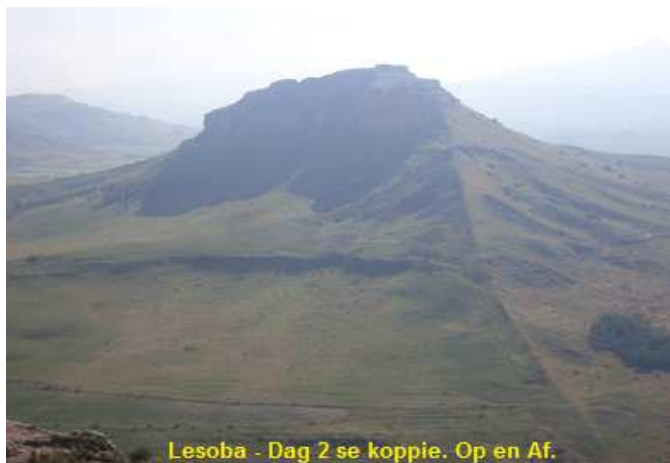
Lesoba - Dag 2 se koppie. Op en Af.

al heelwat beskadig is en 'n paar baie mooi sandsteen oorhange. Dag 1 is sowat 11Km. Dag twee is sowat sowat 7Km lank, maar 'n lang en aanhoudende steiging teen die grasbedekte voet van die kop wat ons die vorige dag so duidelik kon sien. 'n paar mooi klip oorhange weer op die roete en baie mooi plantegroei, maar geen bome nie. Oor die kop se plate, eet en rus 'n bietjie daar en dan weer skerp af aan die anderkant, en die laaste entjie met die grondpad terug na die basiskamp.